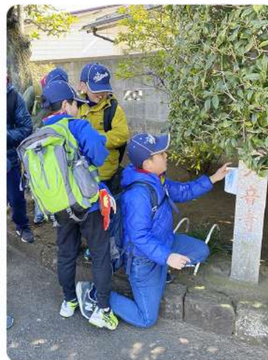
世田谷区内の石碑をまわる、「てくたくハイク」