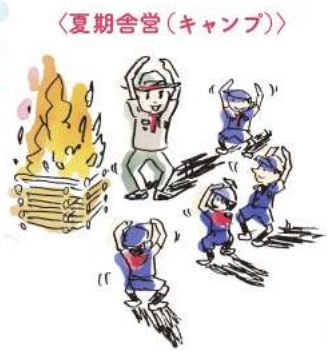
〈夏期舎営(キャンプ)〉