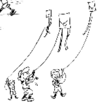
〈たこ作り・たこ揚げ〉