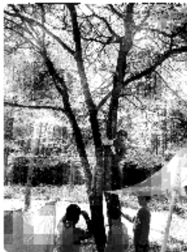
夏期舎営(キャンプ)での、秘密基地づくり