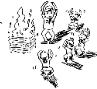
〈夏期舎営(キャンプ)〉