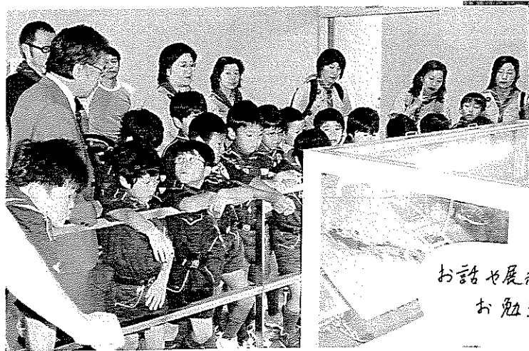
お話や展示でお勉強

10月12日、学芸大学駅から徒歩十分程の所にある「地震の学習館」に行きました。館内では、地震のメカニズム等の話を分かりやすく説明して頂き、体験コーナーでは地震の揺れ、煙、消火等の体験をしました。 平成7年に起きた阪神淡路大震災は直下型の地震でしたが意外と短く、関東大震災は20秒位と長かったそうです。災害は、いつ起こるか分からないので、普段からの備えと心がけを感じ、とっさ的確な判断で慌てないようにと、改めて地震の恐ろしさを感じた一日でした。