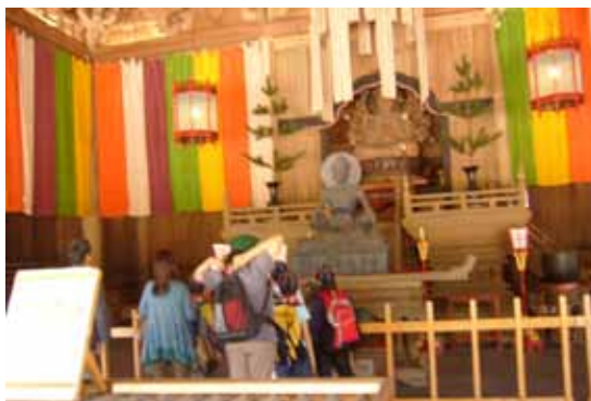
おお、なんかお祈りしてみるか……。

3月の下見に来た時には一人でしたが、みんなで歩くとやっぱり楽しいですね。是非保護者の方もご参加を！さあ次は大山登山。水とう・雨具・服そうなどを自分で（！）しっかり用意し、ピークを目指してレッツ・ゴー！