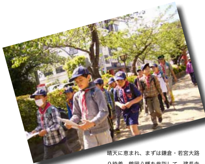
晴天に恵まれ、まずは鎌倉・若宮大路9時着。鶴岡八幡を参詣して、建長寺へ。