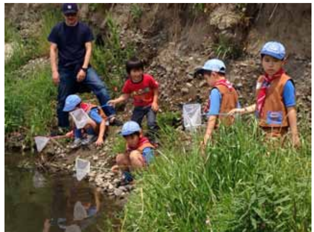
多摩川で小魚探索中。最近、ずいぶんきれいになりましたね、多摩川。