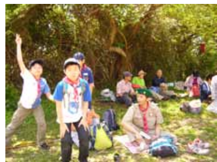
天園ハイキングコースをあるいて、お弁当タイム！