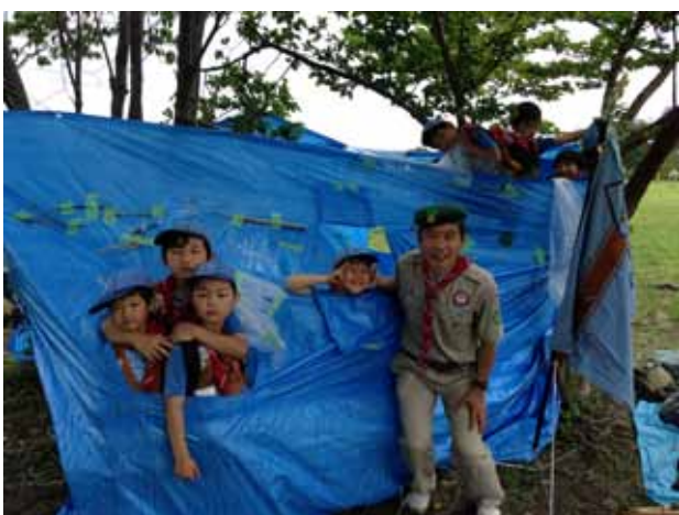
ビニールシートで基地をつくりました。「やっほー」。