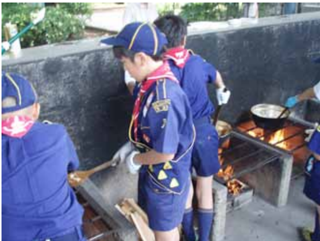
マッチをする練習もしました。