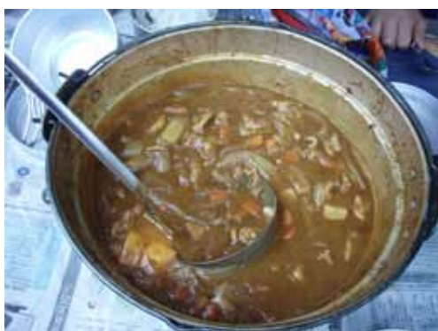
12時全組無事カレー完成。