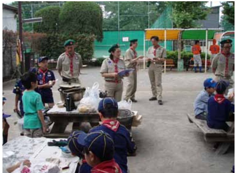
10 時野毛町公園デイキャンプ場着。

ちなみに、カレーに使った武器、食器は自分で洗ったかな?! それがおほんとの、後片づけだよ!