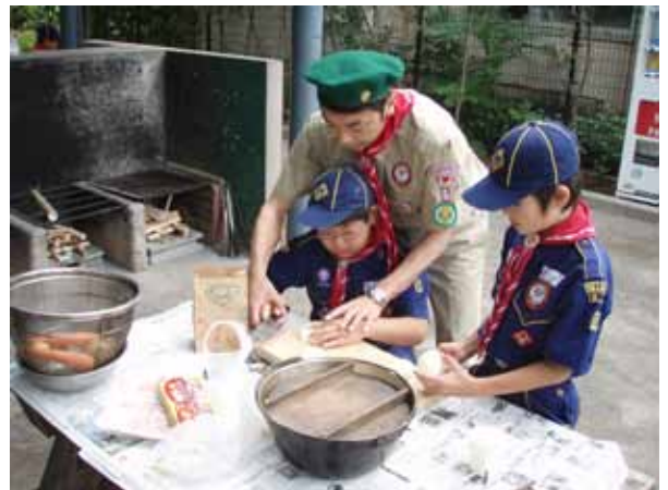
手取り足取り「猫の手で！」