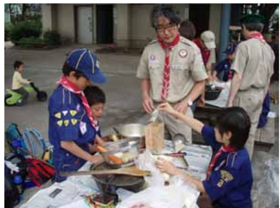
デンリーダーも指導に熱が入る！？