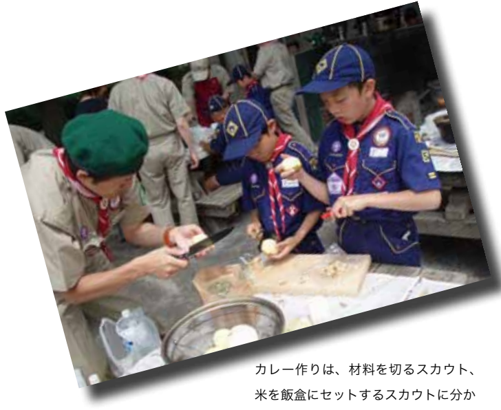
カレー作りは、材料を切るスカウト、米を飯盒にセットするスカウトに分かれて行う。

4組はカレーにベーコンを追加してカレーを作りました。でも、ベーコンを細く切りすぎて、食べる時にはほとんどみあたりませんでした。そして4組はカレーで2位でした。くやしかったけど、味はおいしいって言ってもらいました。たのしかったです。