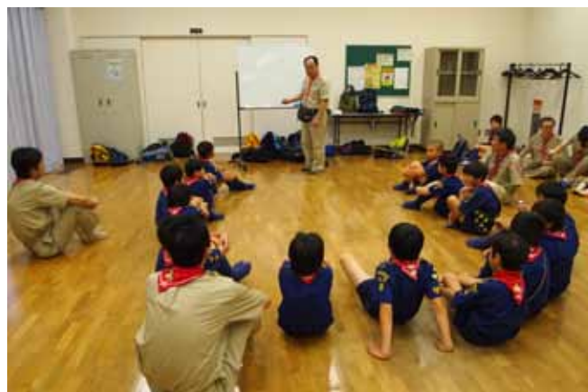
雨のため、大山登山はとりやめ、雨天プロを行いました。

山には登れなかったけど、全力力を合わせて時間内に完成させることができ、なかなかいい雨プロになりました。