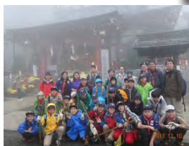
ゴールの阿夫利神社で記念撮影。ちょっと降られたけど、それもいい経験だったかな？