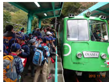
ケーブルカーで登山口まで。 けっこうな傾斜がありました。