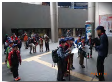
6時45分、二子玉川駅集合。 曇り空がちょっと怪しい？