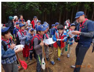
中腹の見晴台で休憩。「山頂はあそこ！」と指差された先は、けっこう遠いぞ〜。