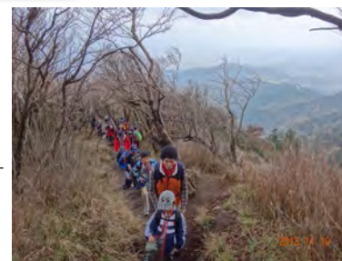
登りは割りと足場の良いコース。風が冷たい〜！