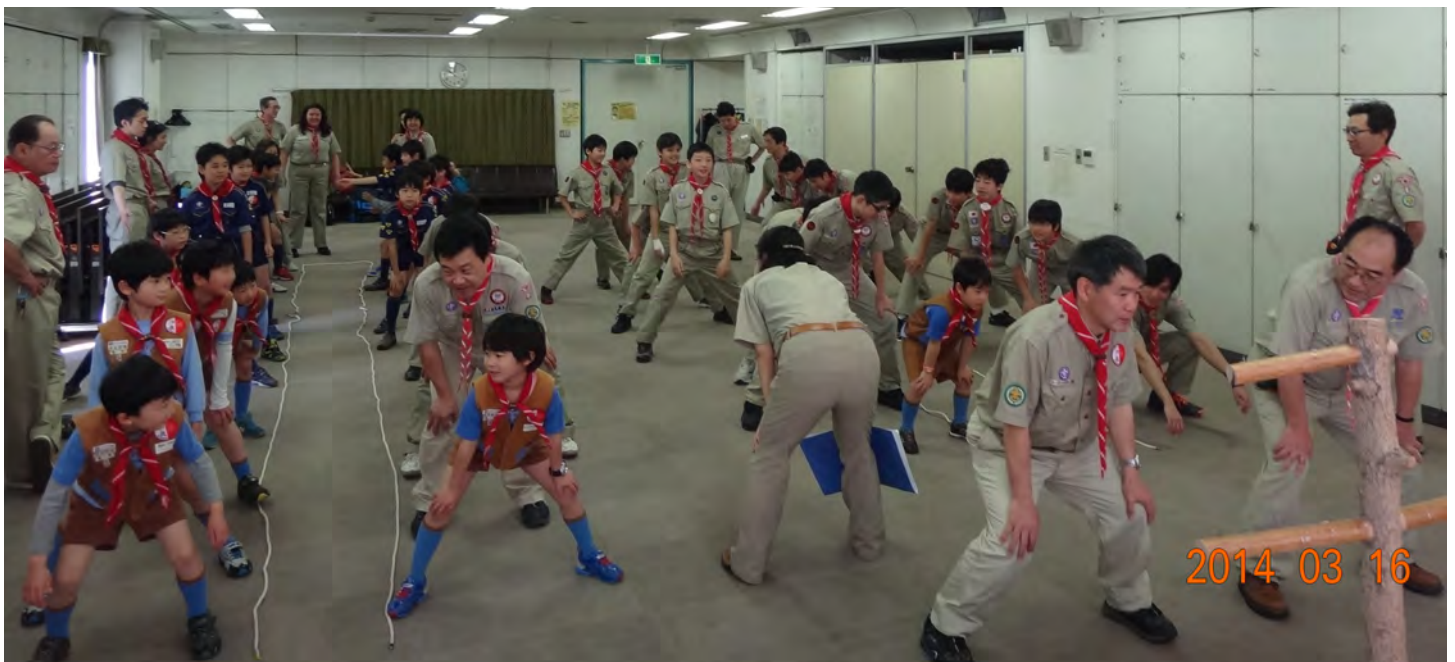
「誓い」のあとは、親睦を深めるゲームを。みんな本気でがんばりました！