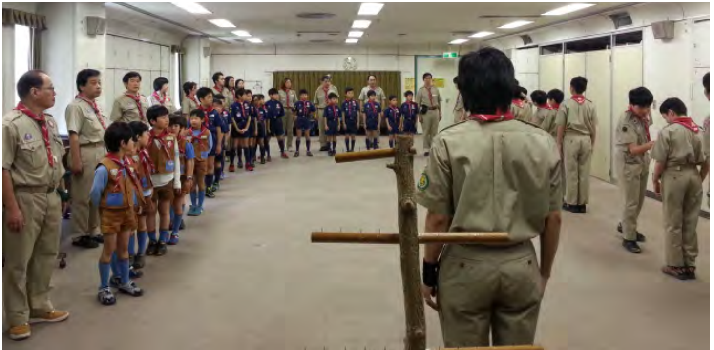
世田谷5団がみんな一同に会するBP祭。はじめはスカウトたちが「誓い」を立てます。